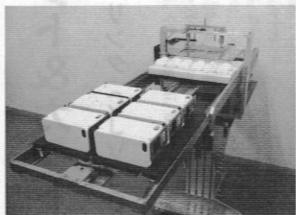
段取り時間を大幅に短縮する「治具自動交換装置」

具製作だけでなく、治 具の自動交換を行い多 品種・小ロット生産の 段取り時間を大幅に短 縮する「治具自動交換 装置」を開発し、「J」 プリンターのメーカー から注目を集めてい る。